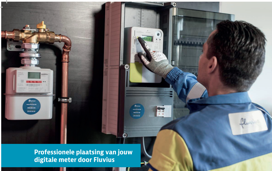
Professionele plaatsing van jouw digitale meter door Fluvius